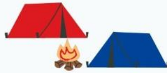
Kamp groep 8