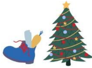
Sint en Kerst