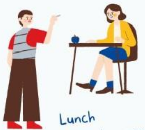
Lunch Dag van de Leraar